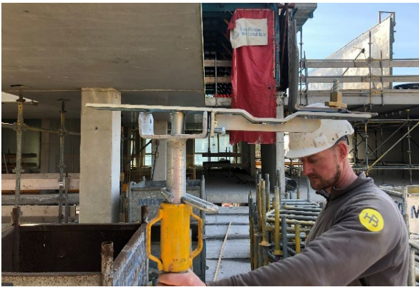
Plaats de B-Pro beugel op een stempel