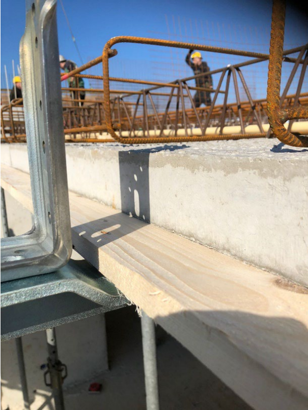
Plaats het dichtzethout