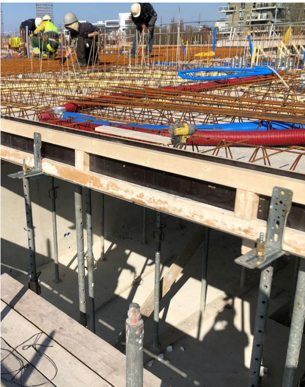
Plaats de randkist en schroef deze vast aan de XL-hoeken