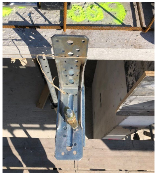
Lijn de XL-hoeken onder een draad uit

Aan deze documentatie kunnen geen rechten worden ontleend. Wijzigingen voorbehouden.