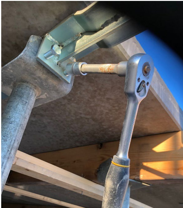
Draai de bouten aan