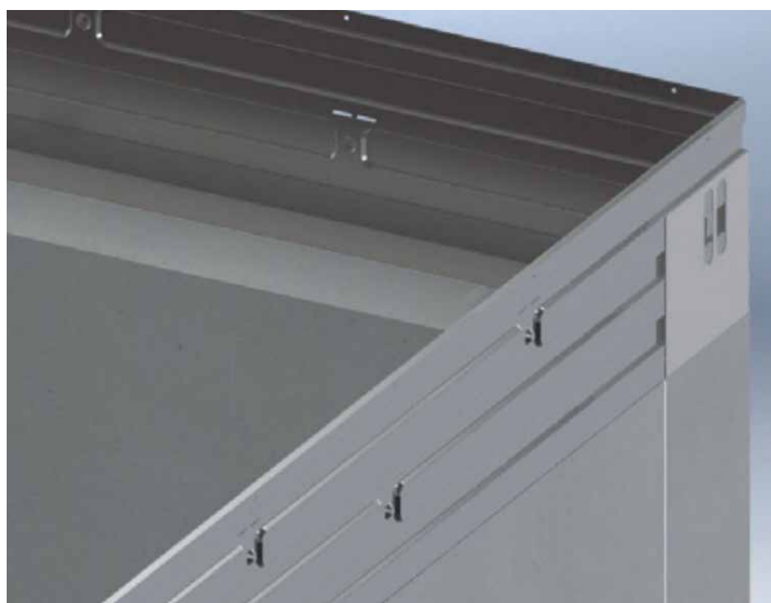
2. Randbekisting op de dragende binnenspouwbladen en/of woningscheidende muren plaatsen t.p.v. de hoekstukken koppelen m.b.v. binddraad 3. Randbekisting bevestigen aan de constructie d.m.v. stalen ribnagels \text{\O} 2,7 \times 25 (HJZ o.g.) of schieten met een minimale nagellengte van 15 mm: minstens vier nagels per plaatlengte van 2 m 4. Nagels bevestigen op minstens 50 mm vanaf de rand van de onderliggende constructie 5. Randbekisting minimaal 65 mm overlappen bij het "koppelen" van de platen