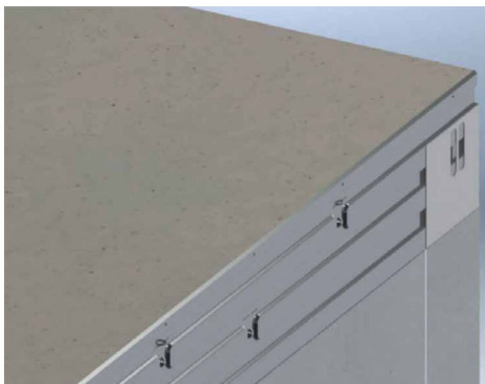
8. Beton afstorten op hoogte van de randkist