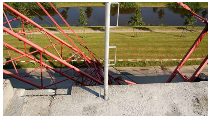
De vloerrandbeveiliging kan in de sparing worden geplaatst