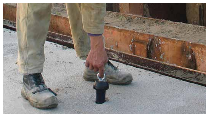
Na uitharding van het beton is de springplug met één vinger te verwijderen