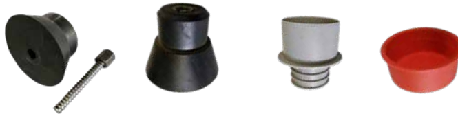
fixatieprop met KO-10 draad