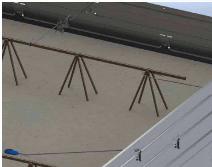
6. Randbekisting zorgvuldig afschoren naar de vloer en/of wapening: wij adviseren per meter twee keer schoren, bij hoogten vanaf 250 drie keer schoren 7. Schoren d.m.v. snelspanners of vlechtdraad (goed wartelen)