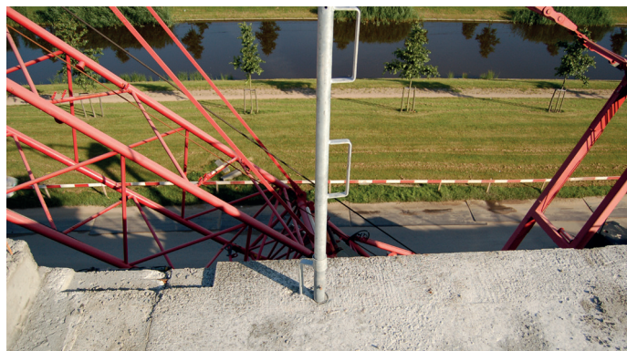
De vloerrandbeveiliging kan in de sparing worden geplaatst