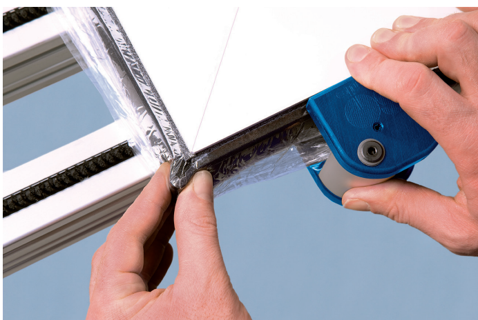
Creëer een lus met het compressieband voor een goede afdichting van de hoeken