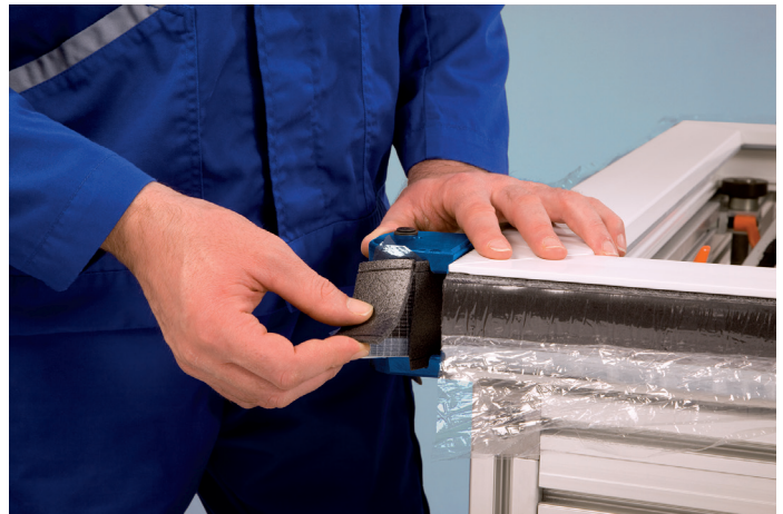
Het verwijderen van het ingesneden gedeelte van de rug van het compressieband