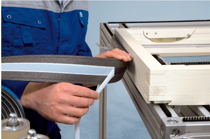
Aanbrengen op een houten kozijn middels de butyllaag, aanvullend vastnieten in de zijstroken