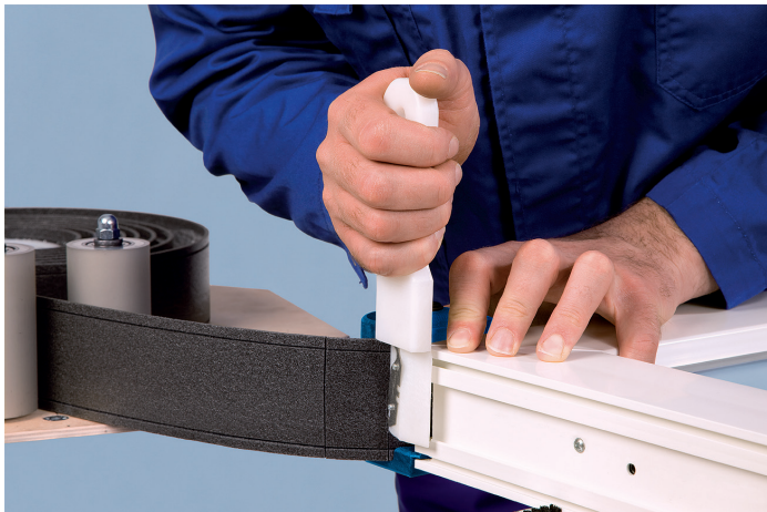
Ter plaatse van hoeken de achterzijde insnijden met de Toolcut