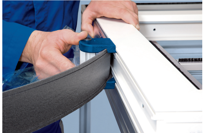
Aanbrengen op een kunststof kozijn, geklemd in de profilering met behulp van de Toolclip