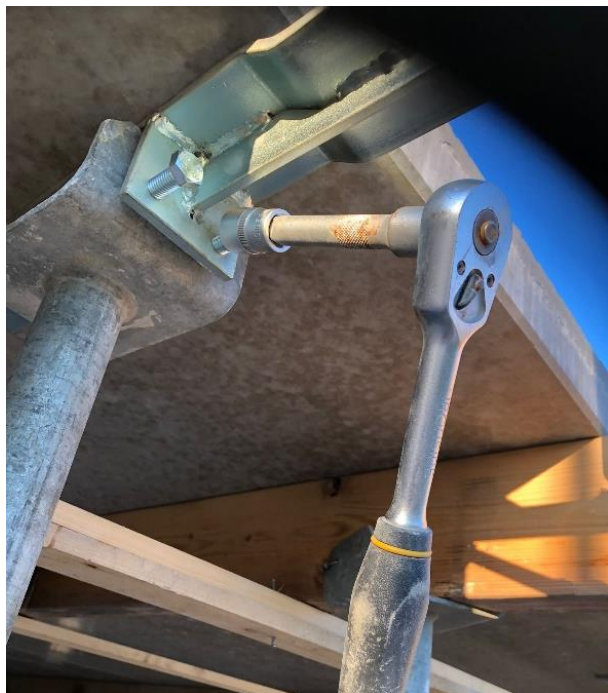
Draai de bouten aan