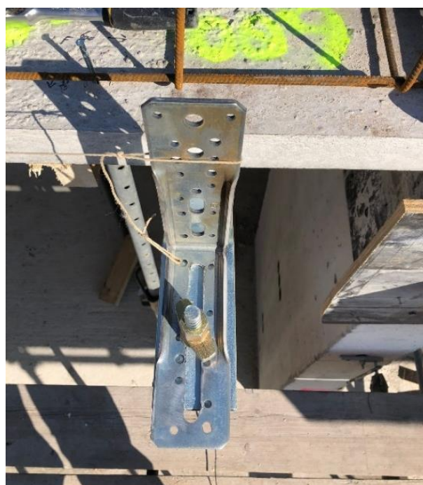
Lijn de XL-hoeken onder een draad uit

Aan deze documentatie kunnen geen rechten worden ontleend. Wijzigingen voorbehouden.