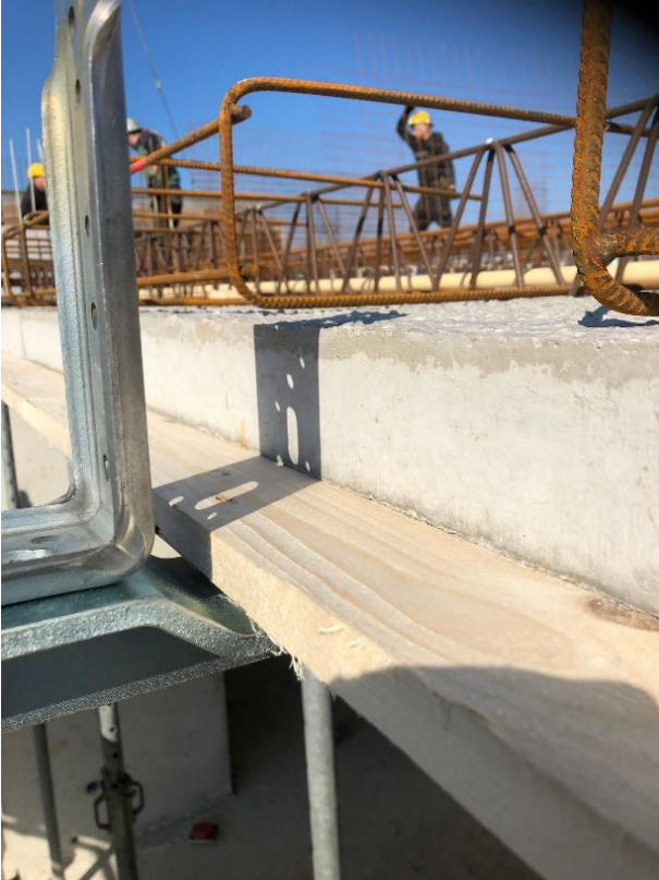
Plaats het dichtzethout