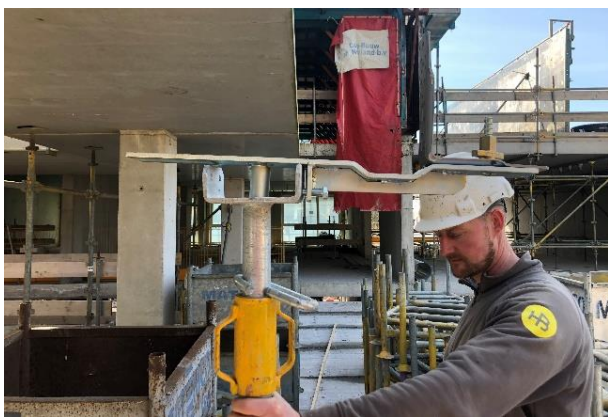
Plaats de B-Pro beugel op een stempel