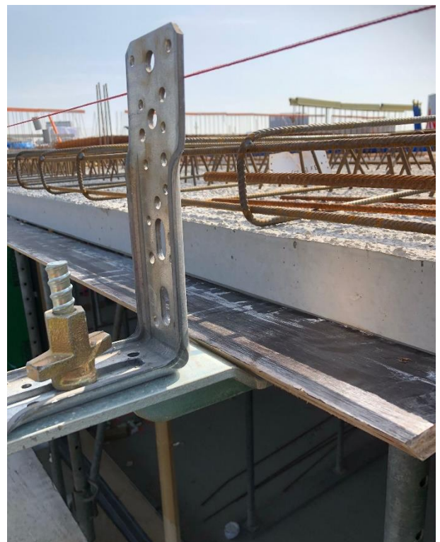
Een zeer strak eindresultaat

Aan deze documentatie kunnen geen rechten worden ontleend. Wijzigingen voorbehouden.