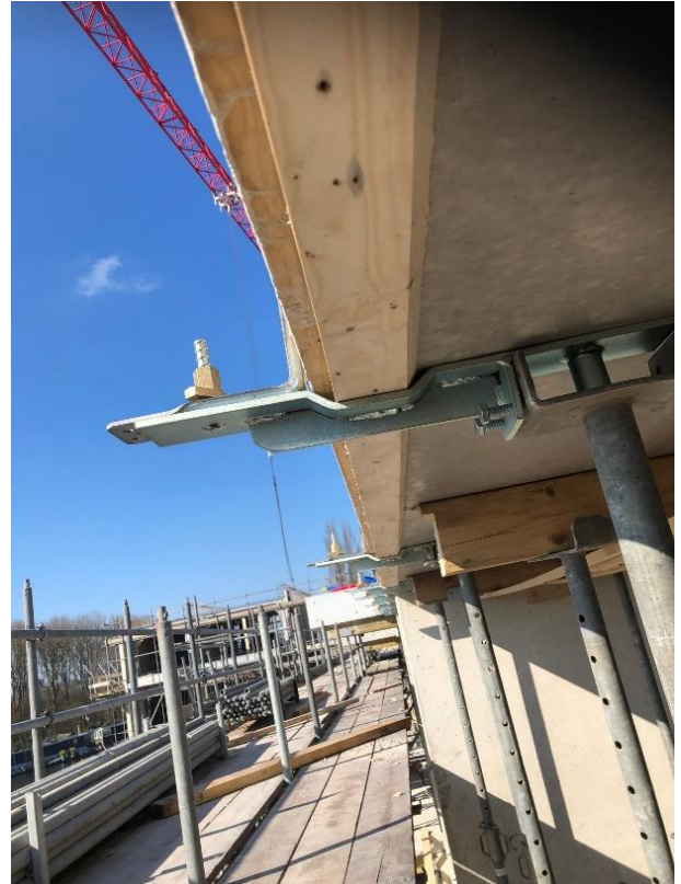
Tip! Schuin het dichtzethout aan de binnenzijde af