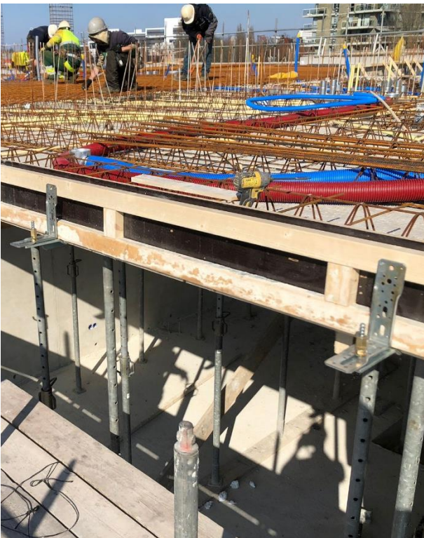
Plaats de randkist en schroef deze vast aan de XL-hoeken