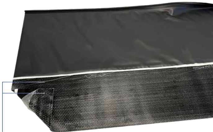
Te verwijderen beschermfolie